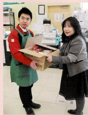
▲ハローズ羽島店から支援団体へ食品引き渡し

2018年9月現在、ハローズの全80店舗で実施、毎月約1,000ケース、5tがフードバンクに提供されており、ハローズとしての廃棄ロスも削減された。